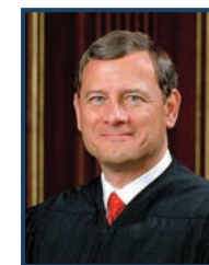
Juez Roberts, Presidente de la Corte