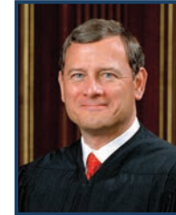
Juez Roberts, Presidente de la Corte