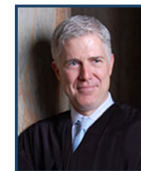
Il giudice Gorsuch