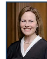
La giudice Barrett

Corte Suprema degli Stati Uniti 1 First Street, NE Washington, DC 20543 www.supremecourt.gov