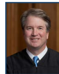
Il giudice Kavanaugh