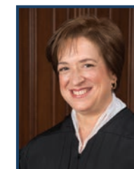
La giudice Kagan