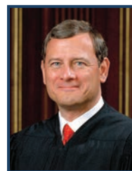
Il giudice Roberts, Presidente della Corte

Situato al primo piano, il salone è uno spazio maestoso, con, su ciascun lato, i busti dei giudici che in passato hanno ricoperto la carica di Presidente della Corte.