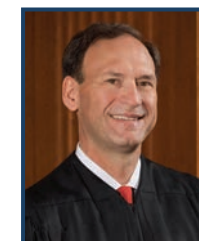
Il giudice Alito