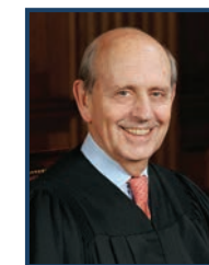
Il giudice Breyer