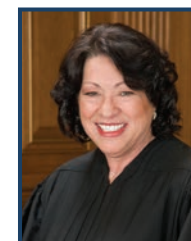
La giudice Sotomayor