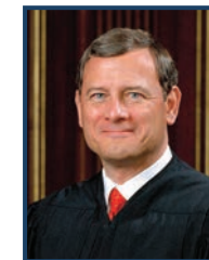
Chief Justice Roberts