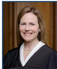
La juge Barrett

Supreme Court of the United States 1 First Street, NE Washington, DC 20543 www.supremecourt.gov