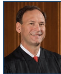
Le juge Alito