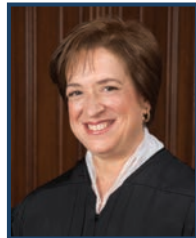
La juge Kagan