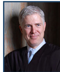
Le juge Gorsuch