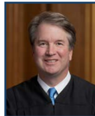
Le juge Kavanaugh