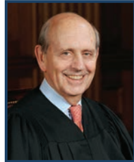
Le juge Breyer